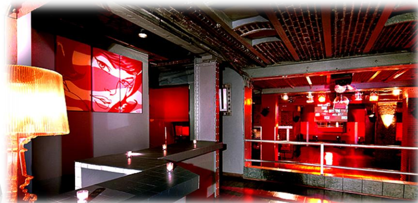
Les Salons du Louvre