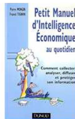
Petit manuel d'IE au quotidien

Ces derniers n'hésitent pas non plus à poser des questions afin d'apporter des réponses concises et claires accompagnées par des exemples et des quiz donnant une approche ludique